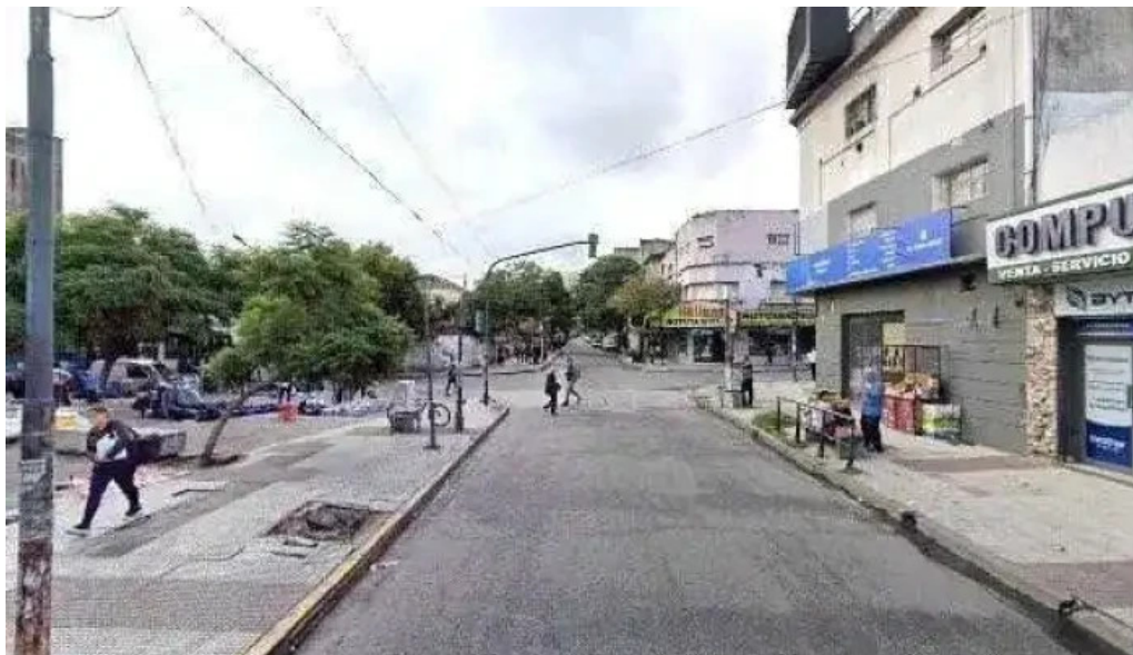
Credito efectivo moron descuentosdeg