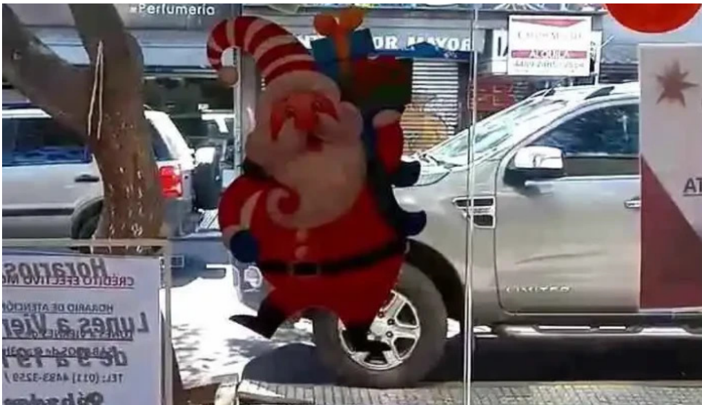
Credito efectivo moron videos