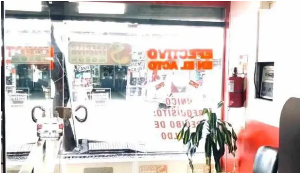
Credito efectivo moron descuentos