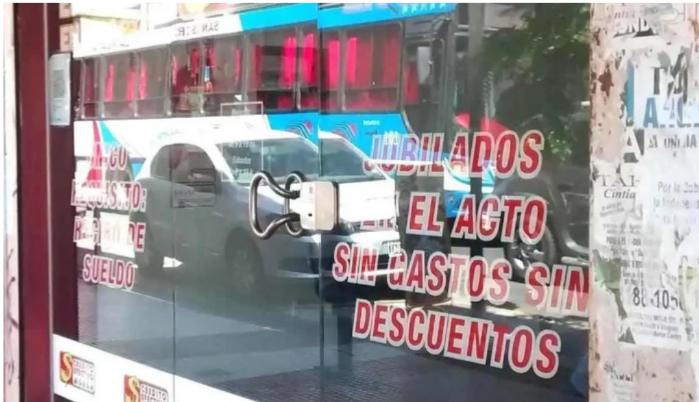
Credito efectivo moron exterior