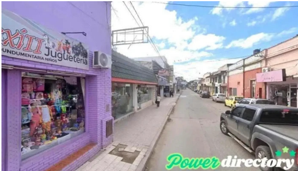
Credito del valle efectivo en el acto metan