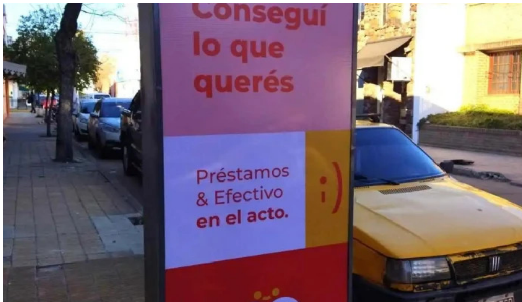
Credivip del propietario