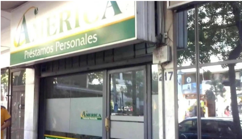
America prestamos personales fotos