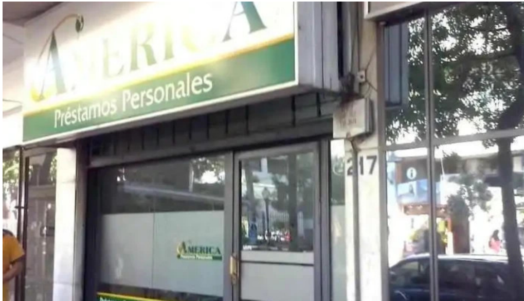
America prestamos personales mendoza