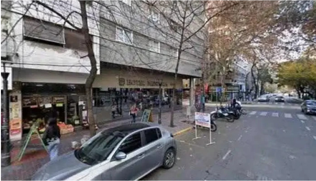
America prestamos personales fotosdeg