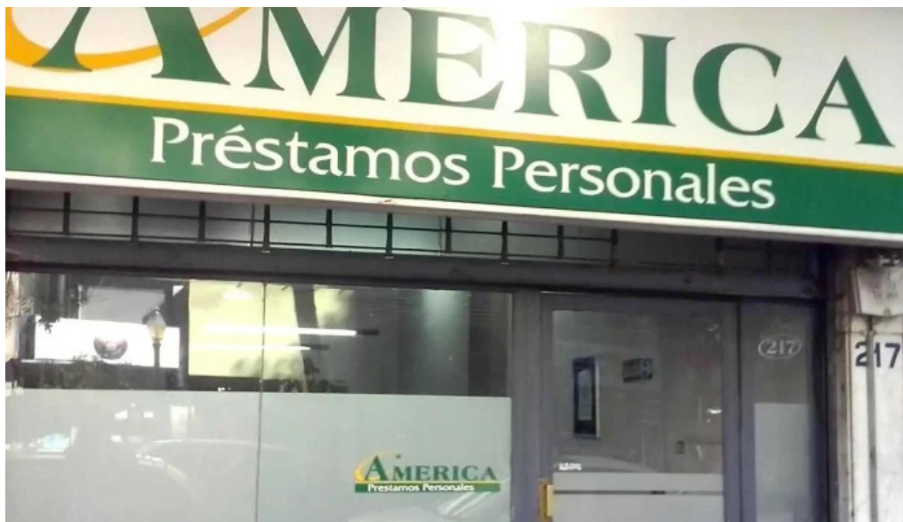
America prestamos personales exterior