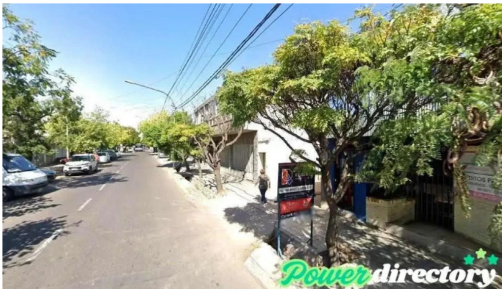
Mutual familiar del nuevo cuyo maipú