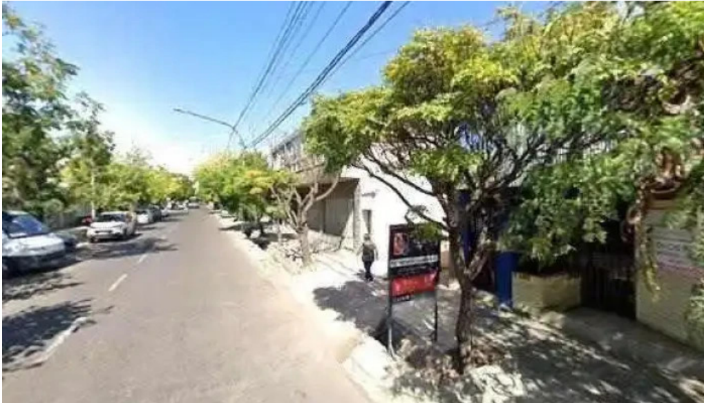
Mutual familiar del nuevo cuyo comentarios