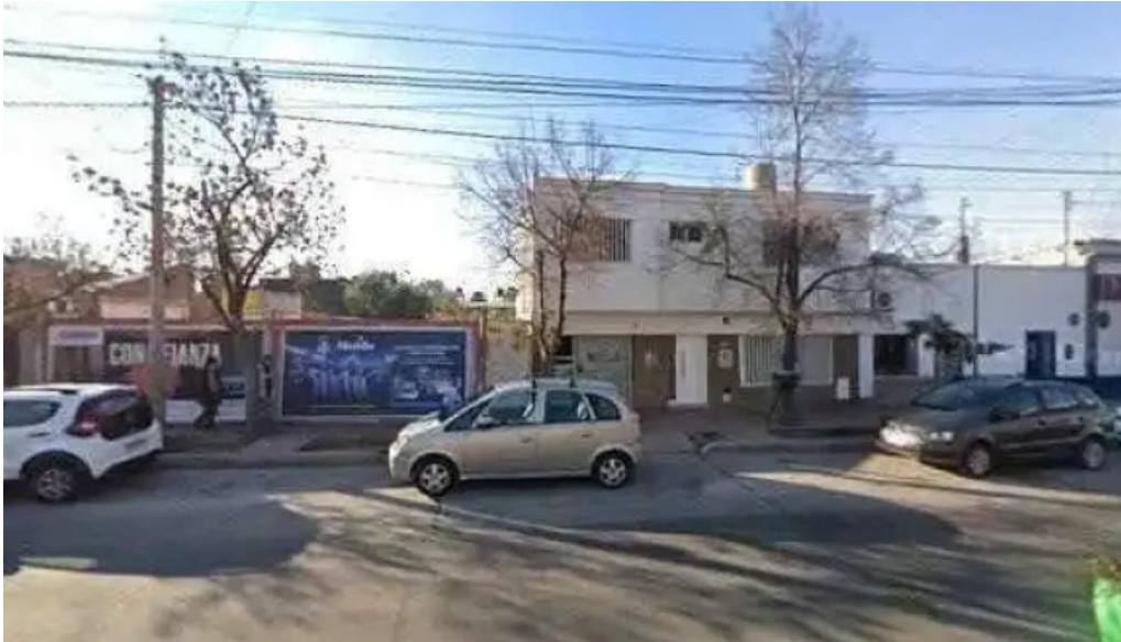
Amas asociacion mutual accion solidaria ubicacion