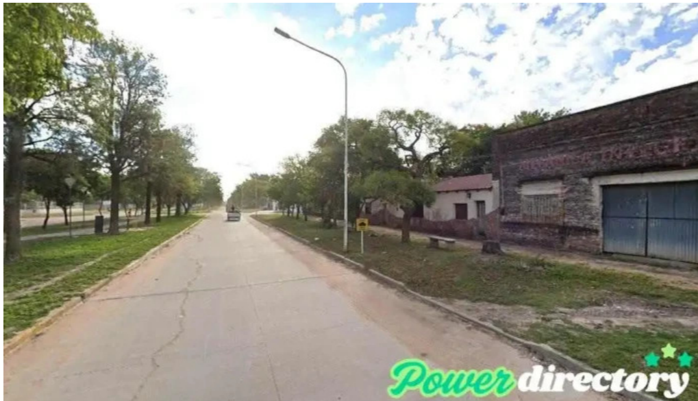
Oficina de prestamos machagai