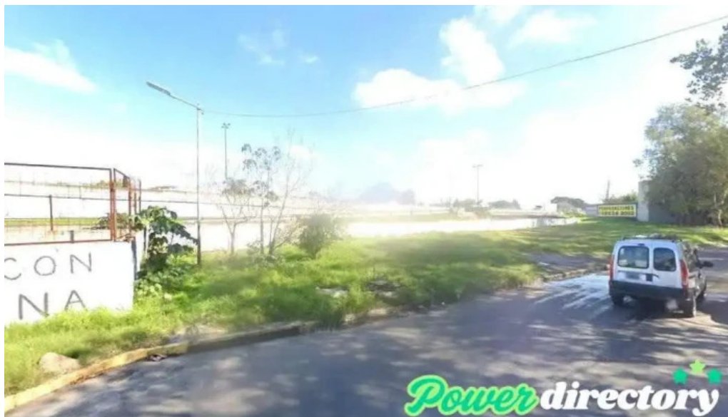
Prestamos lomas de zamora