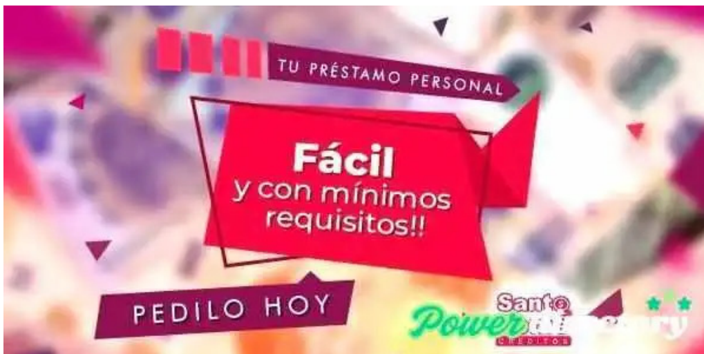
Creditos santo tome horario