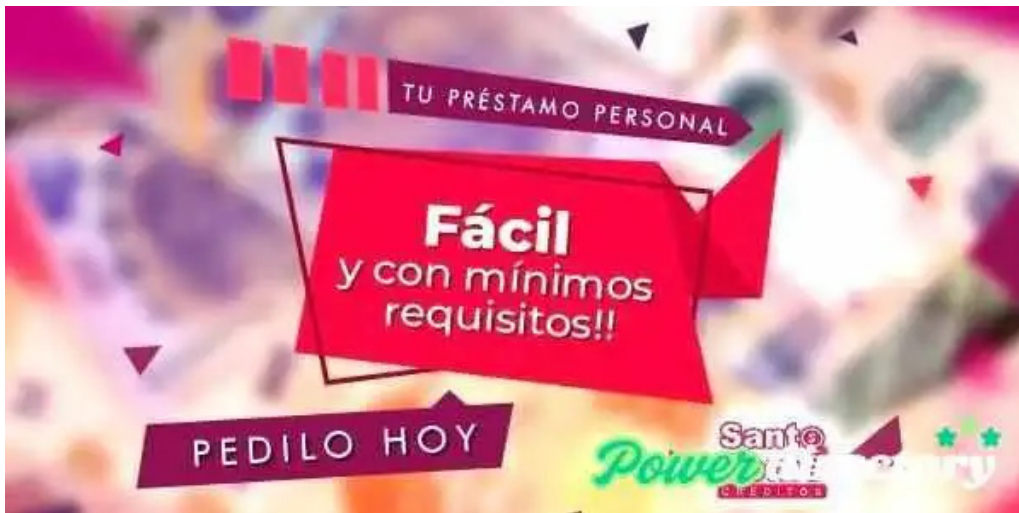
Creditos santo tome lomas de zamora