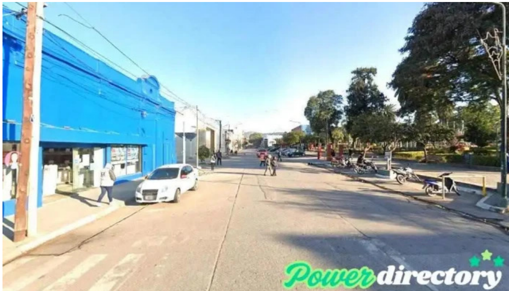
Corefin libertador gral san martin