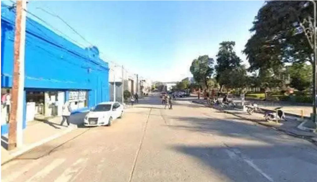
Corefin cerca de mi