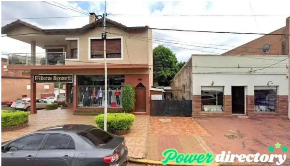
Credito ya del litoral leandro n alem