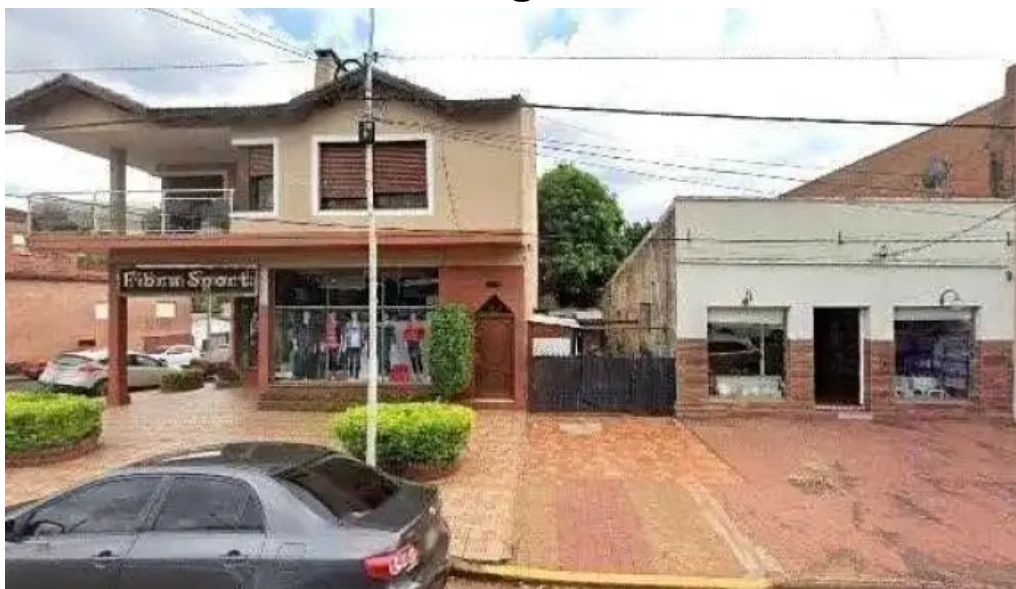
Credito ya del litoral videos