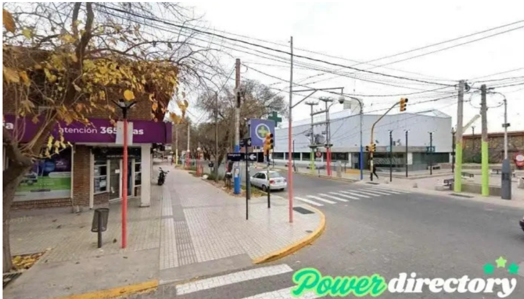
Prestamos personales las heras