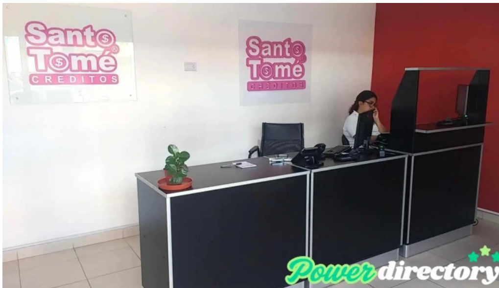
Creditos santo tome interior