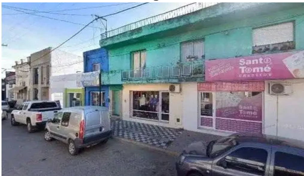
Creditos santo tome sitio webdeg