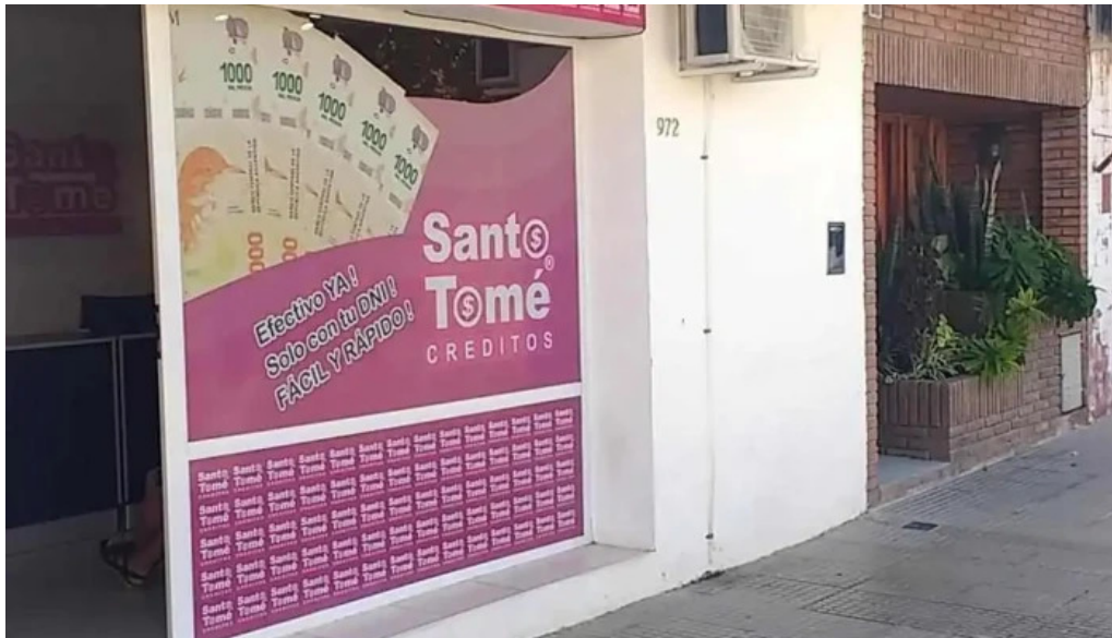
Creditos santo tome exterior