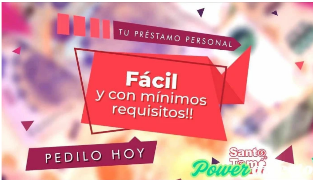
Creditos santo tome la paz