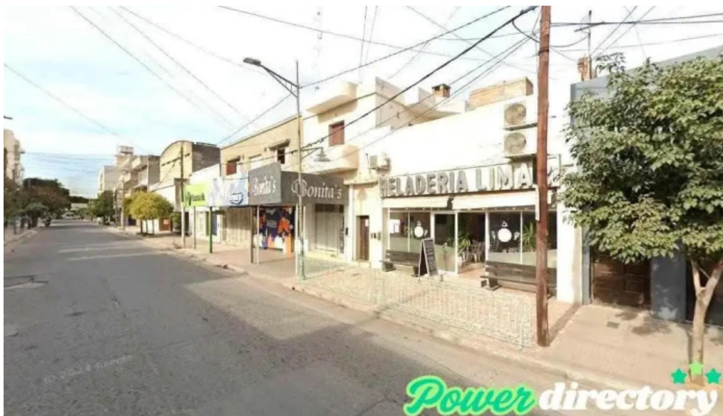
Corefin la banda