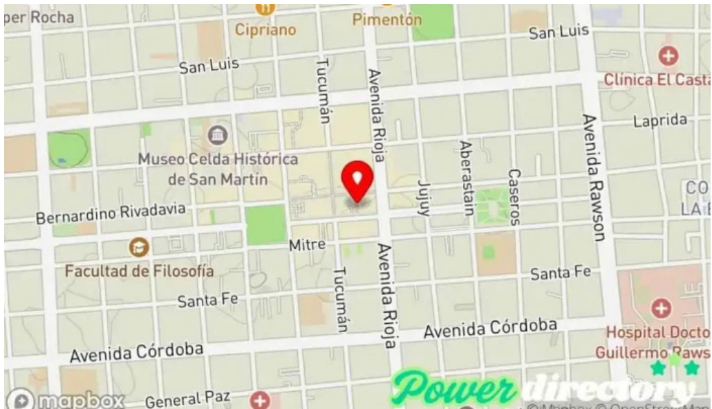
Cc credits prestamos personales mapa