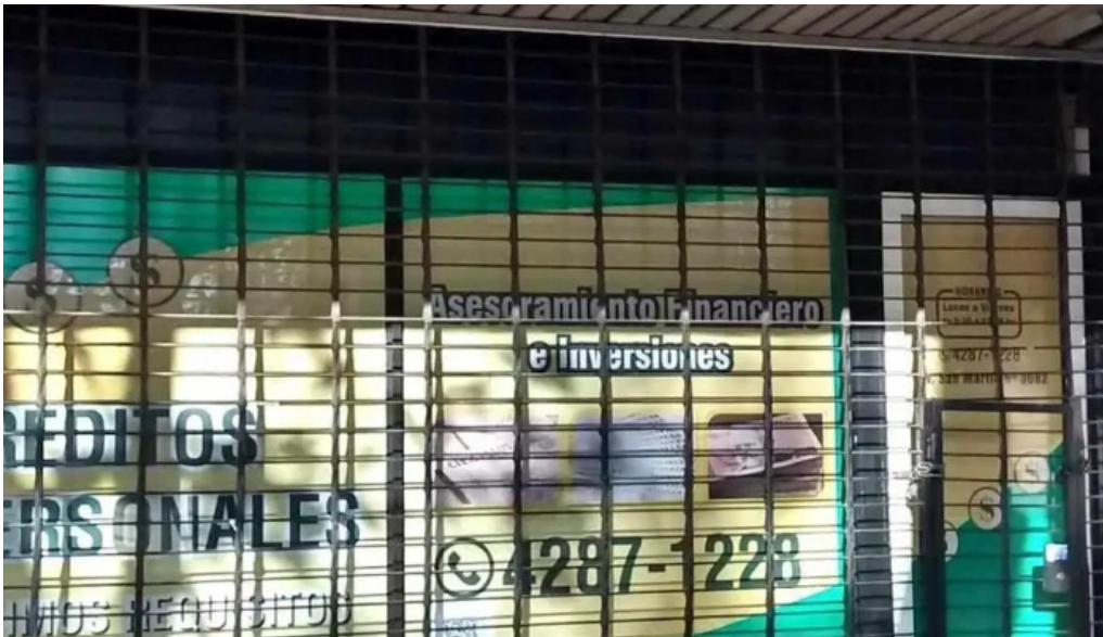
Varela cred direccion