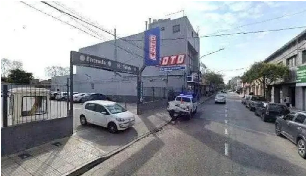
Varela cred direcciondeg