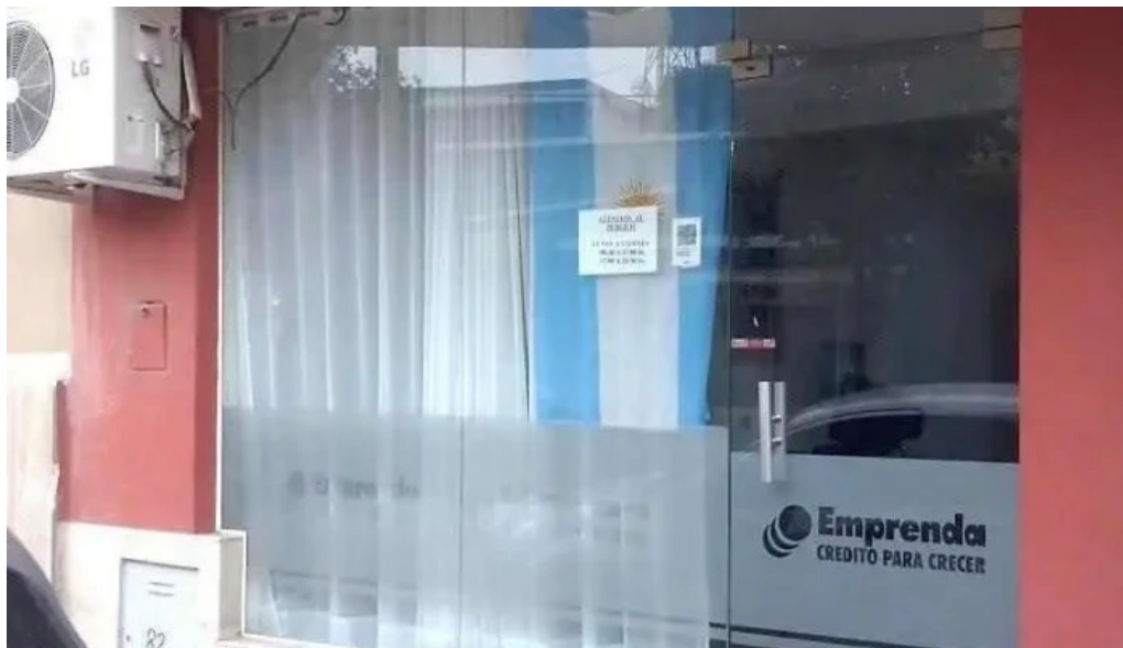
Emprenda gral guemes