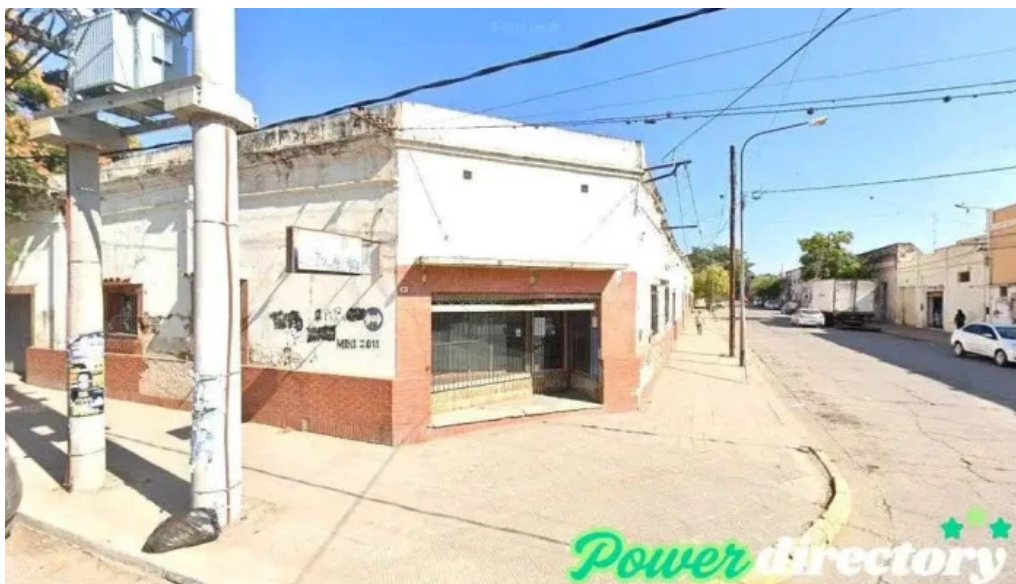
Corefin gral guemes