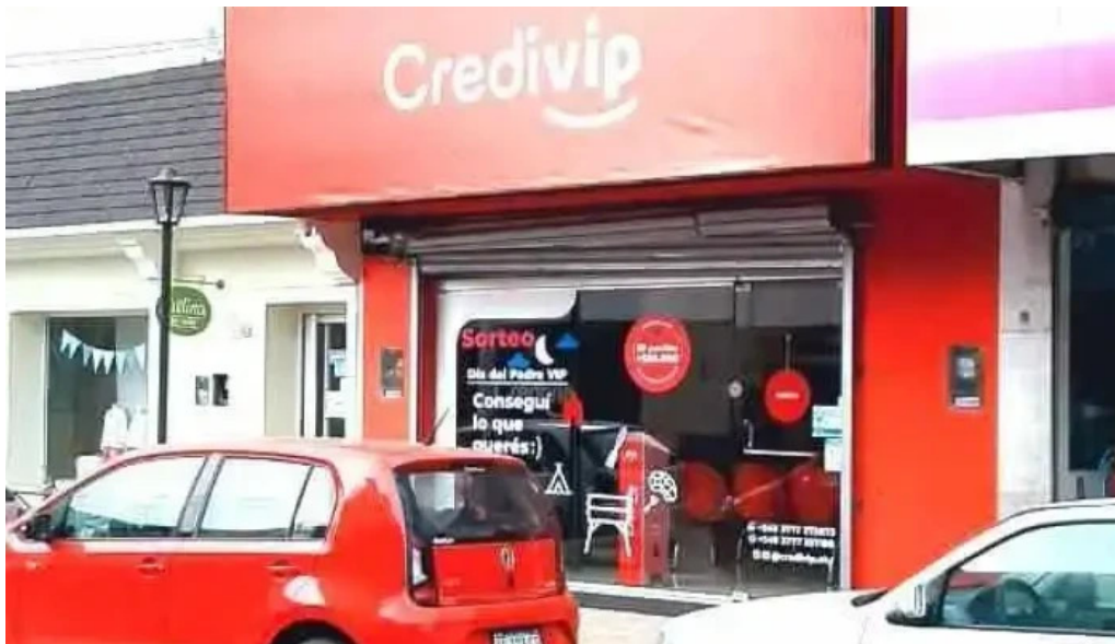
Credivip del propietario