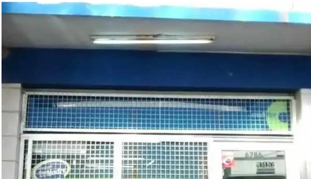
Yo mujer ftn