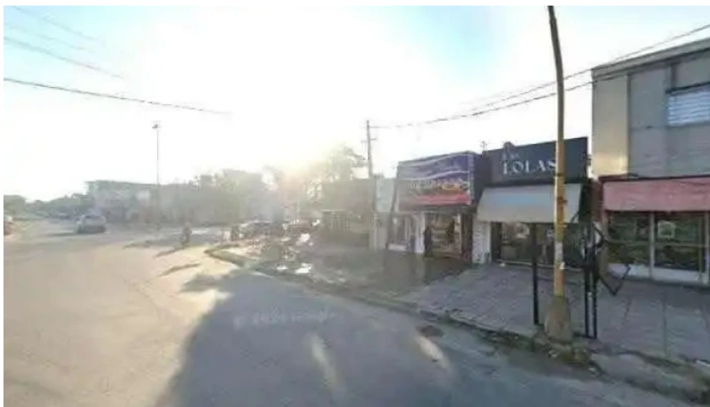
Yo mujer direcciondeg