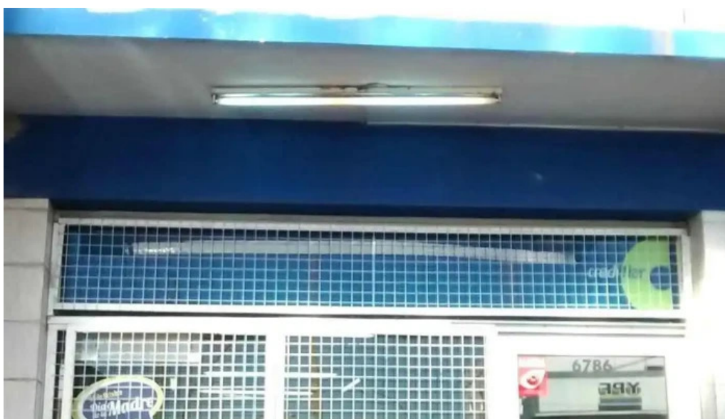
Yo mujer direccion