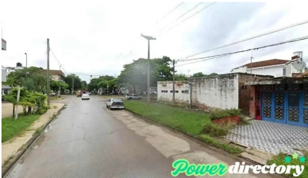
Credito para emprender formosa