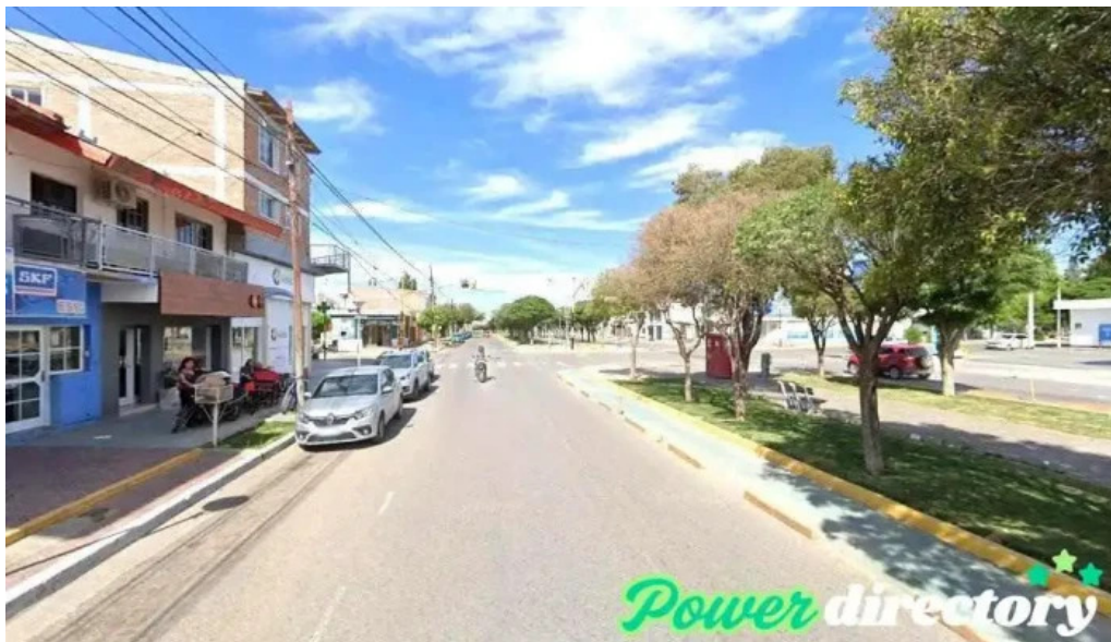
Corefin cutral co