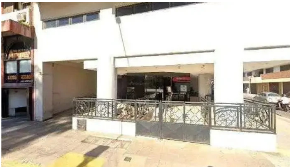
Federar abierto ahora