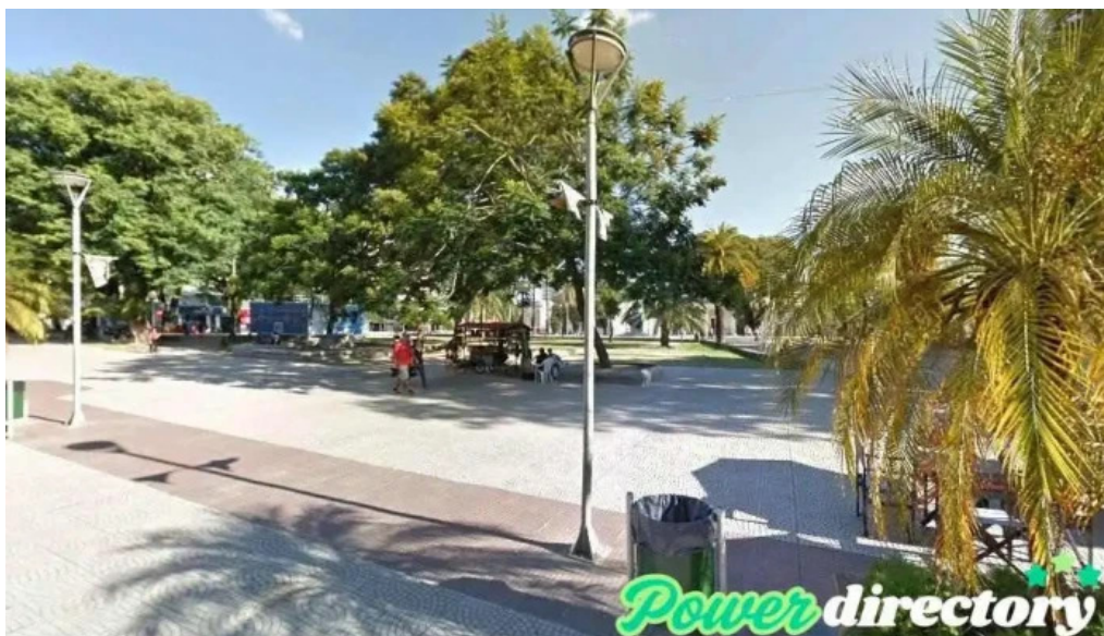
Credito azteca srl corrientes