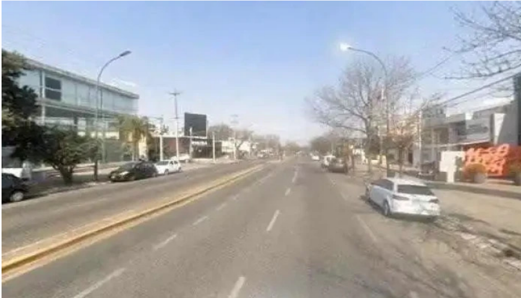
Tarjeta naranja videos