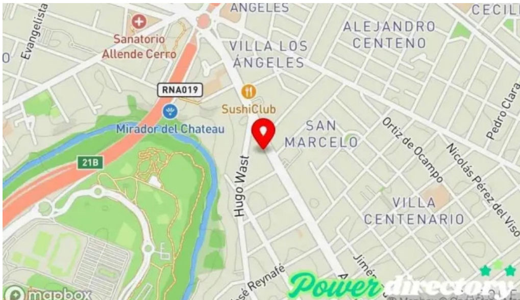
Tarjeta naranja mapa