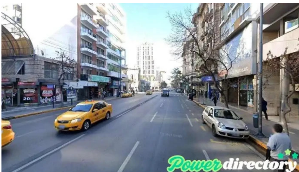
Prestamos candelaria cordoba