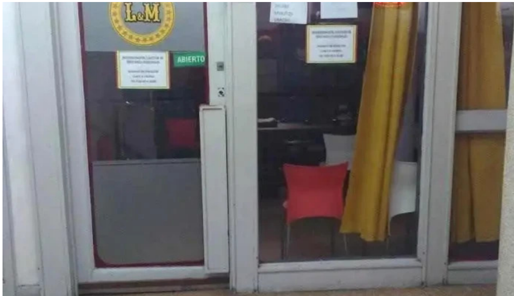
Lym gestion de prestamos cordoba