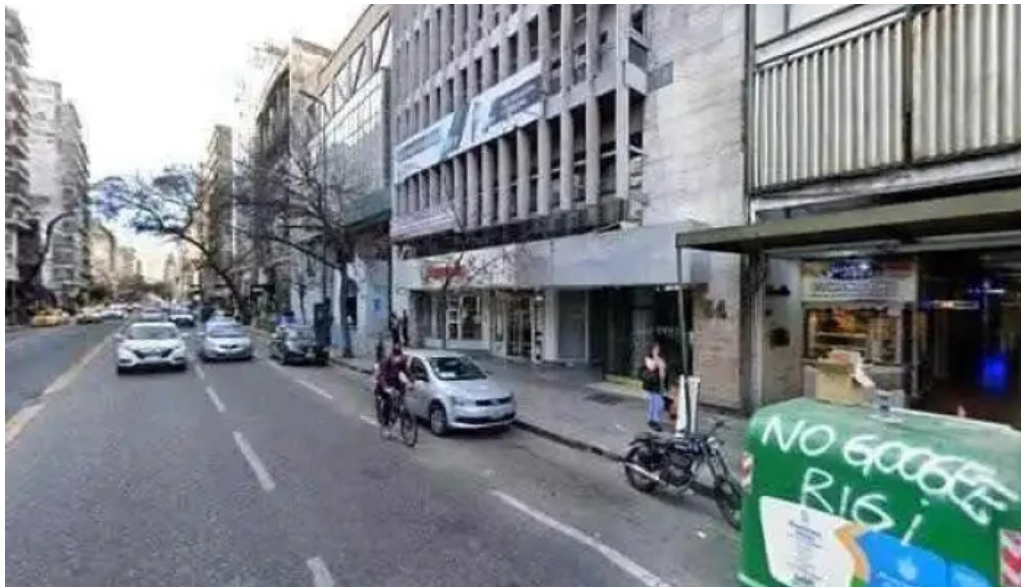
Lym gestion de prestamos instagram