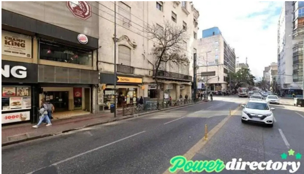
La casa del jubilado cordoba