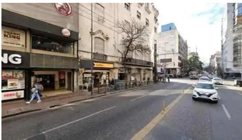
La casa del jubilado fotos