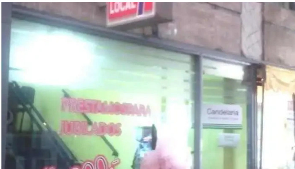
Cooperativa candelaria cordoba