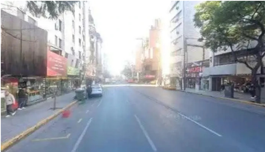
Cooperativa candelaria numero