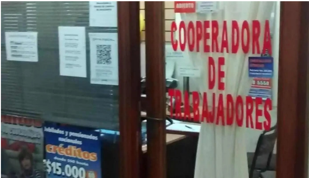
Cooperadora de trabajadores como llegar