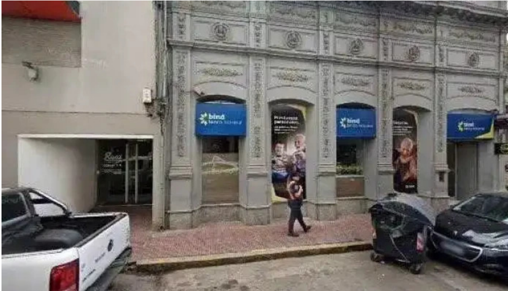
Cooperadora de trabajadores como llegardeg