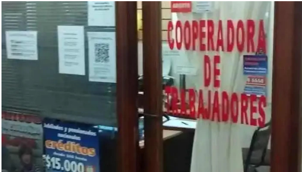
Cooperadora de trabajadores cordoba