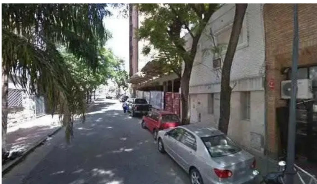
Adelanto simple comentarios