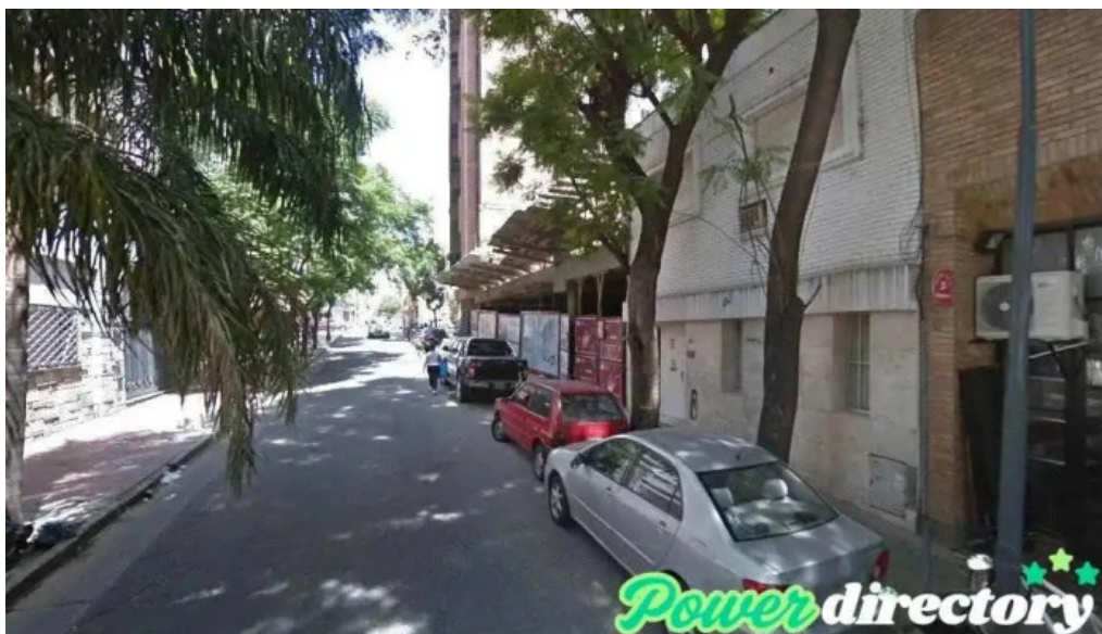
Adelanto simple cordoba