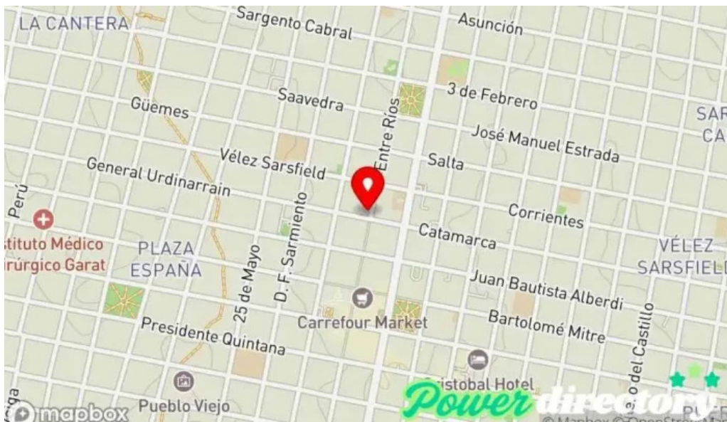
Super cred mapa