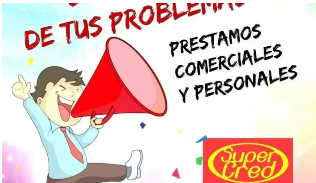
Super cred del propietario