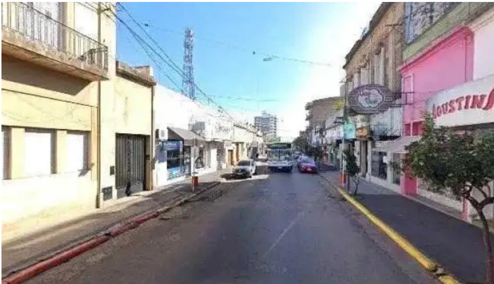
Super cred numero