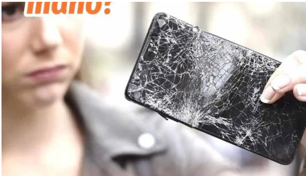
Golcred del propietario