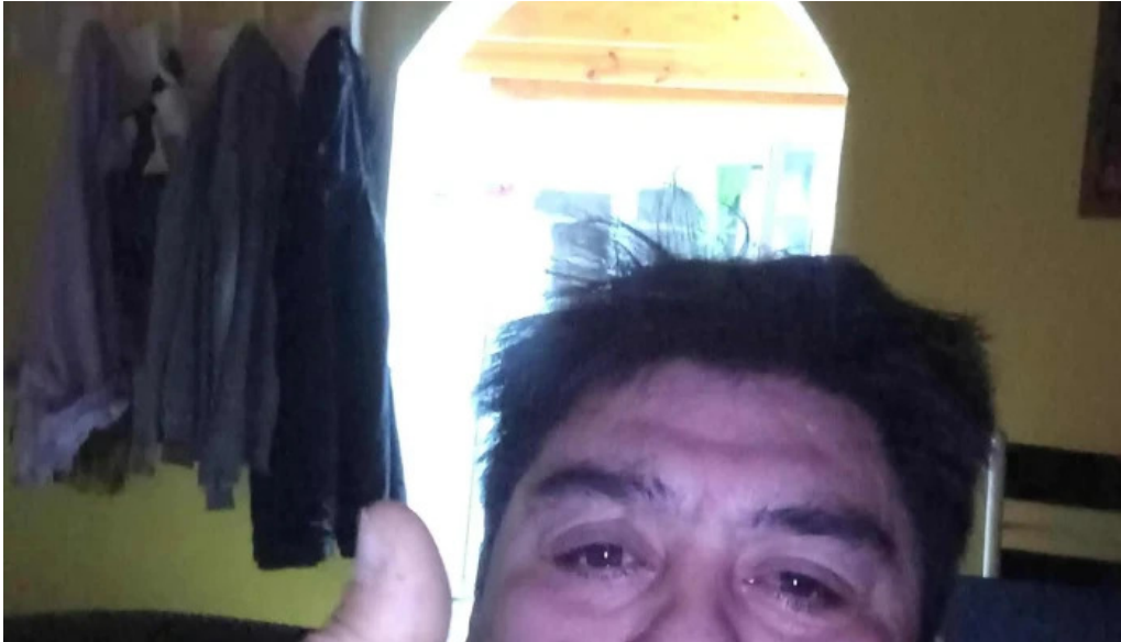
Golcred comodoro rivadavia