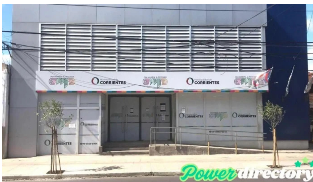
Caja municipal de prestamos de la ciudad de corrientes cnn