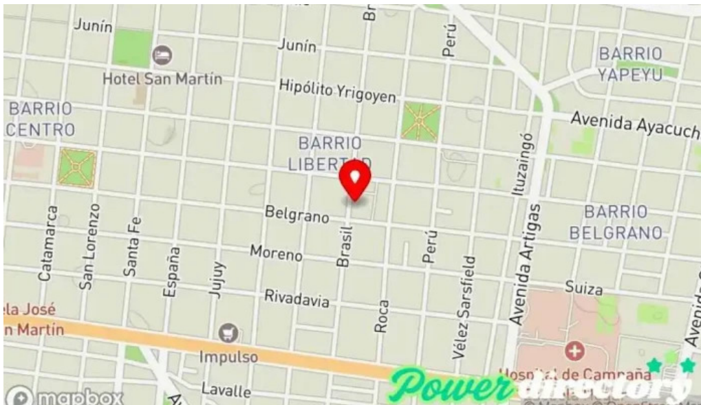
Caja municipal de prestamos de la ciudad de corrientes mapa