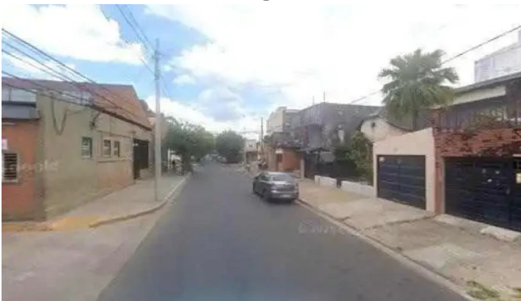
Caja municipal de prestamos de la ciudad de corrientes preciosdeg