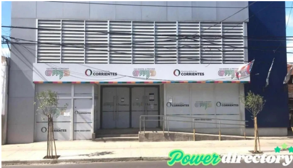
Caja municipal de prestamos de la ciudad de corrientes precios