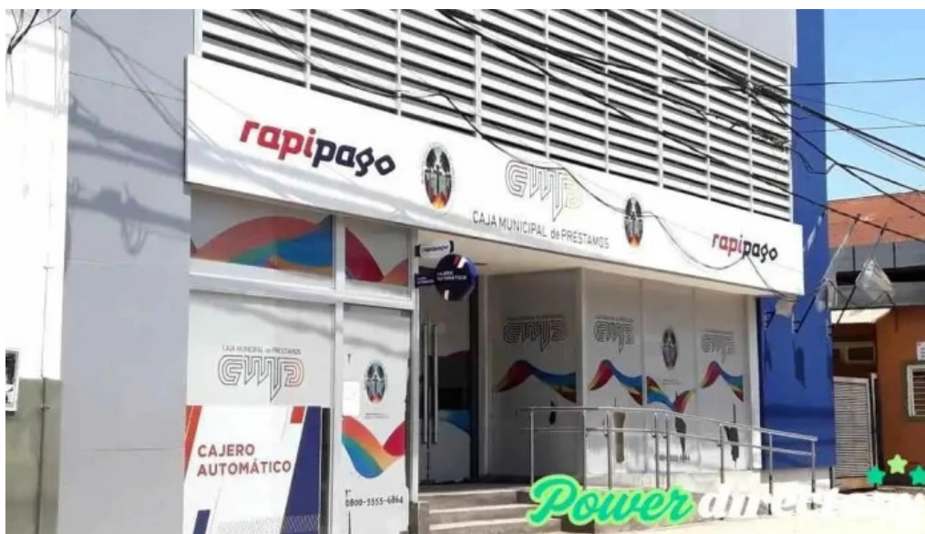
Caja municipal de prestamos de la ciudad de corrientes exterior