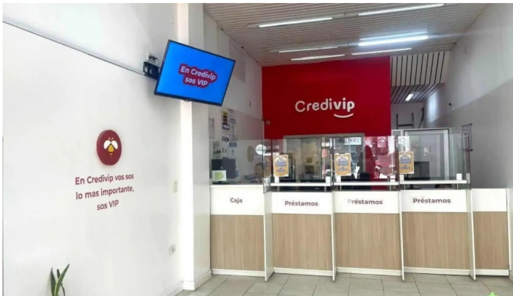
Credivip del propietario