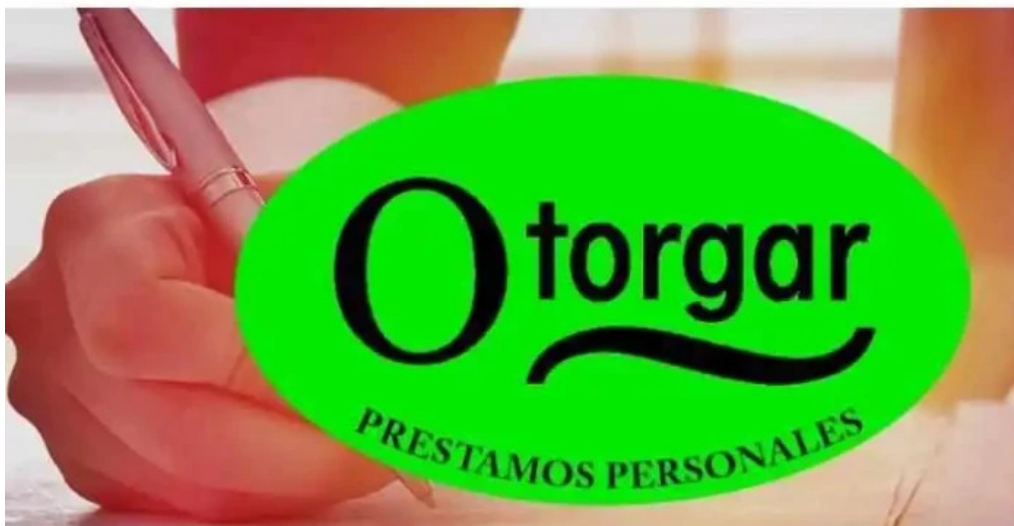
Otorgar prestamos personales del propietario