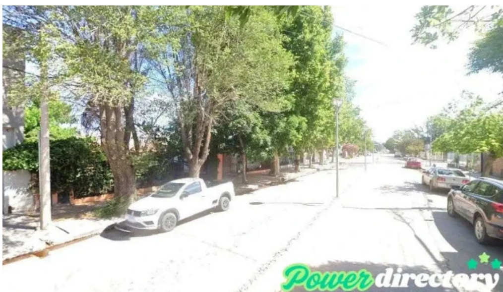
Otorgar prestamos personales cinco saltos