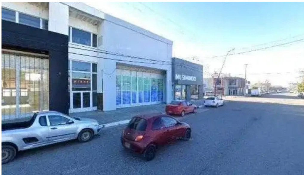
Corefin como llegar