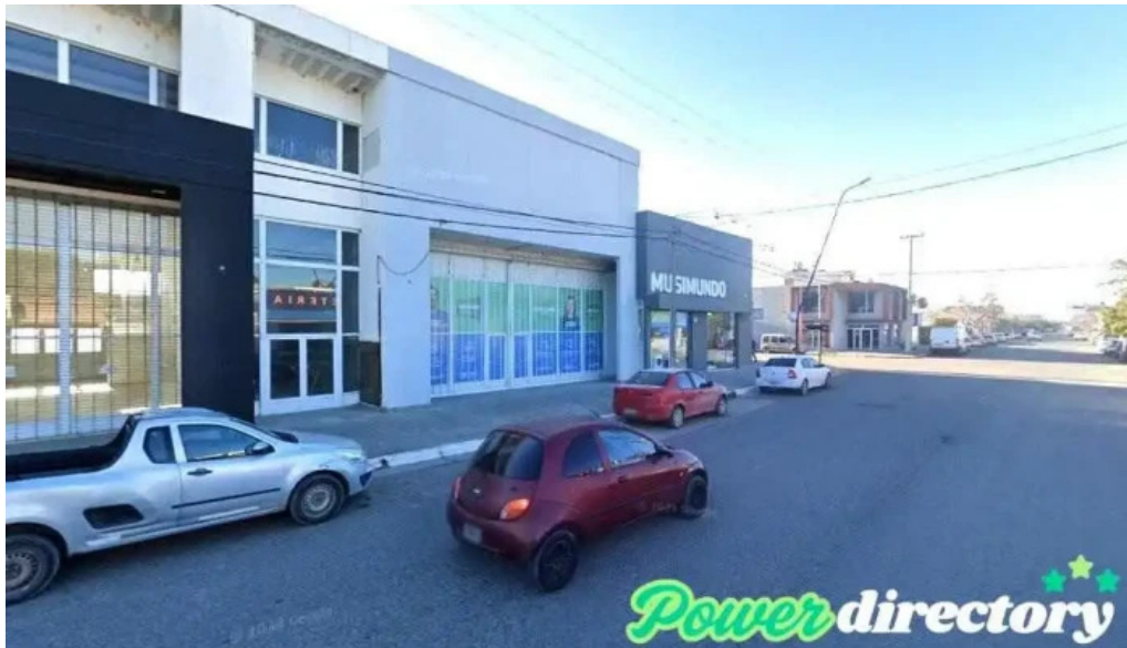
Corefin choele choel