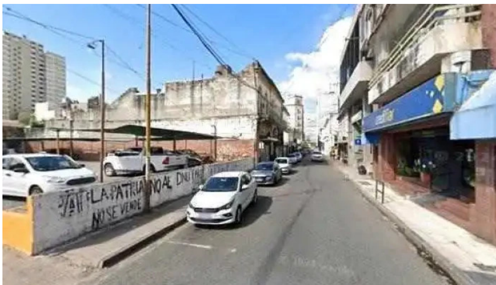
Provincred abierto ahora