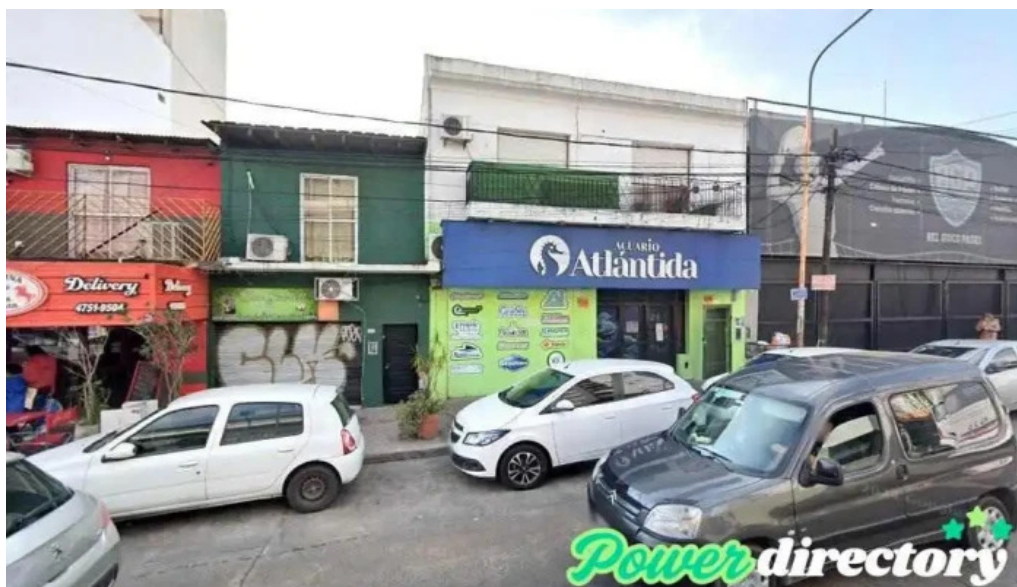
Prestamos palomar cdad jardin lomas de palomar