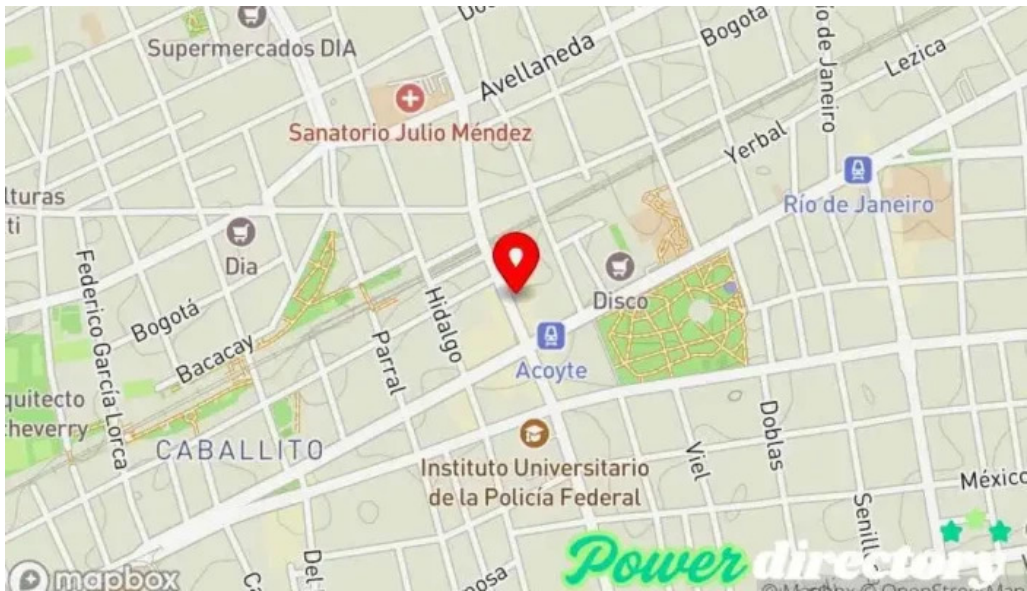
Prestamos personales mapa