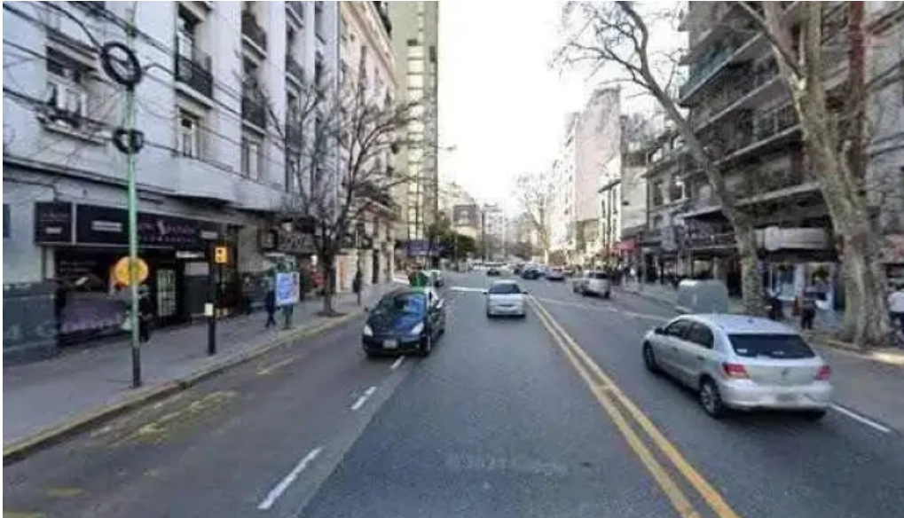
Prestamos personales telefono