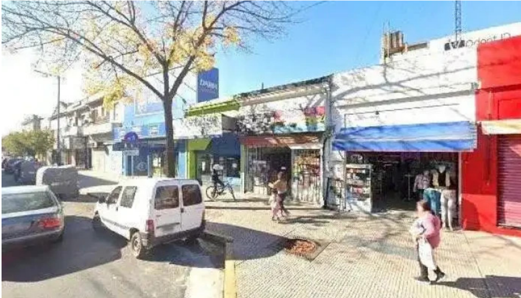
Prestamos como llegar