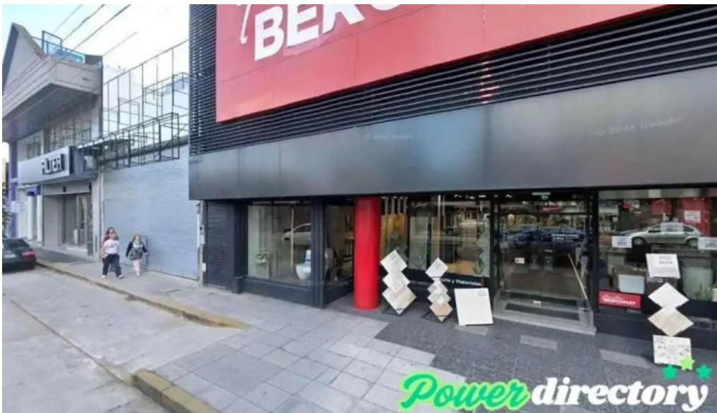
Prestamo de la casa cdad autonoma de buenos aires