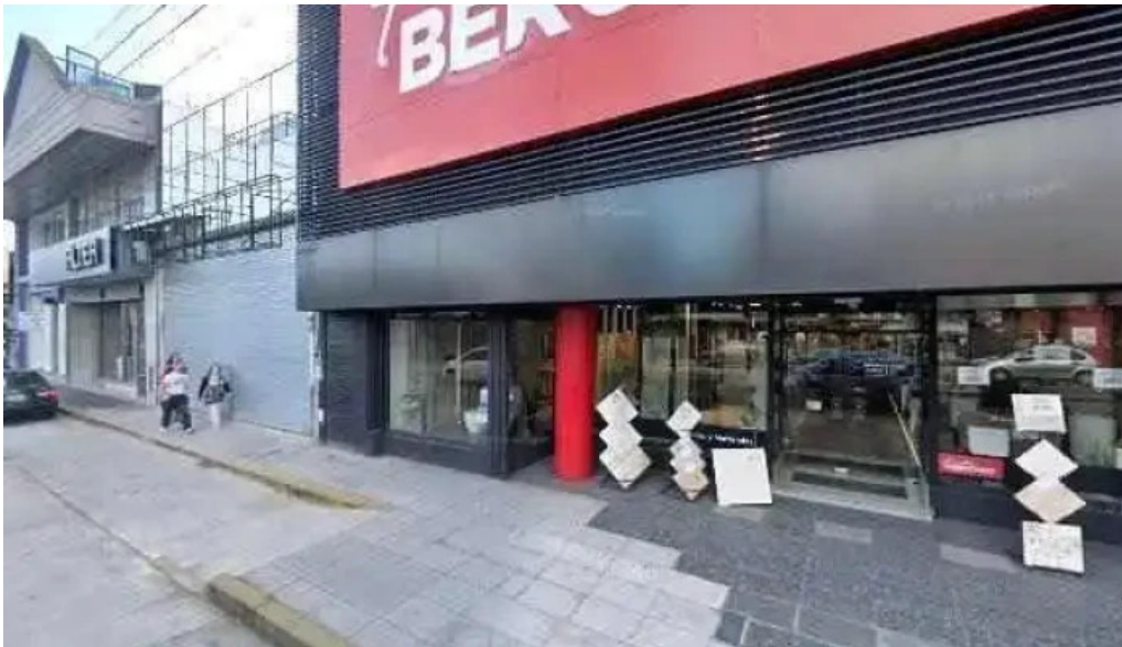
Prestamo de la casa fotos