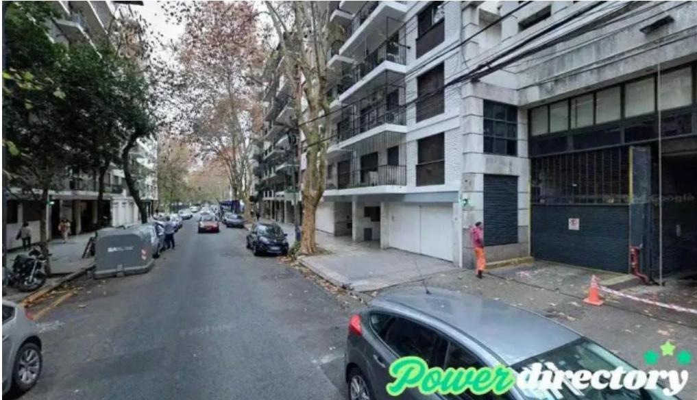
Metrofinanzas srl cdad autonoma de buenos aires