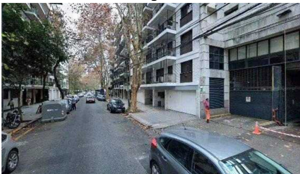
Metrofinanzas srl zona