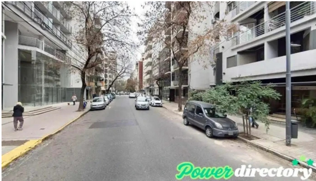
Efecton prestamos en segundos cdad autonoma de buenos aires