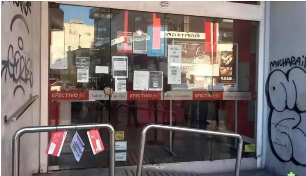
Efectivo si primera junta direccion