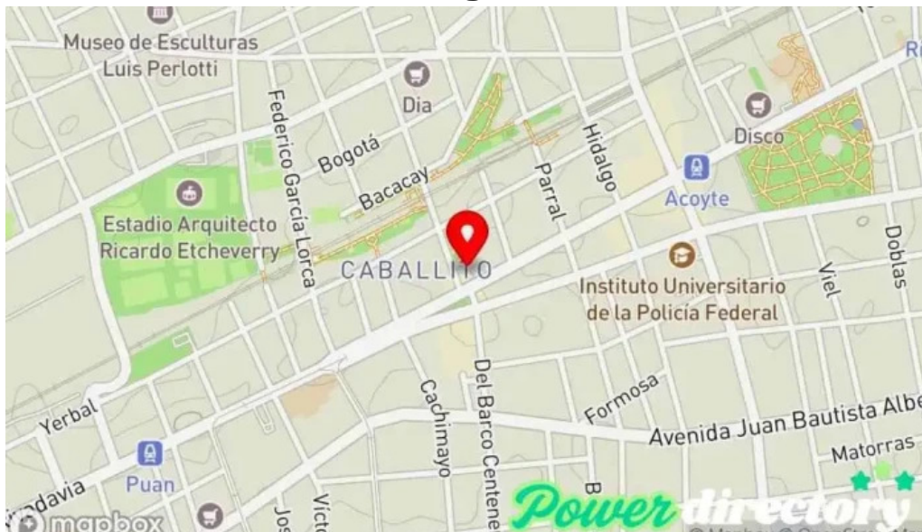
Efectivo si primera junta mapa