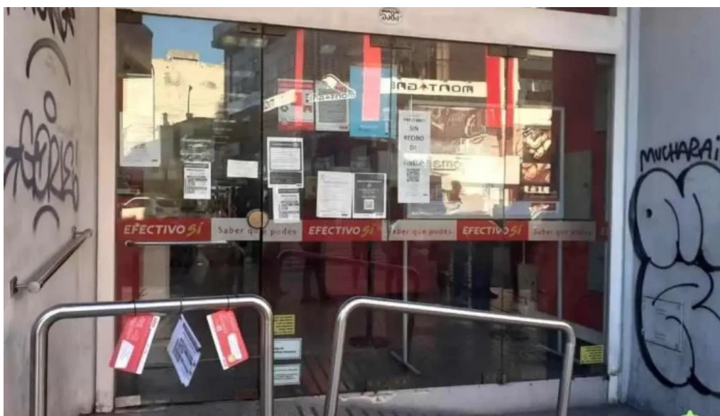
Efectivo si primera junta cdad autonoma de buenos aires