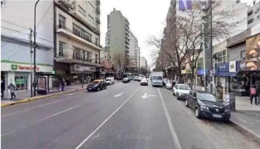
Efectivo si primera junta direcciondeg