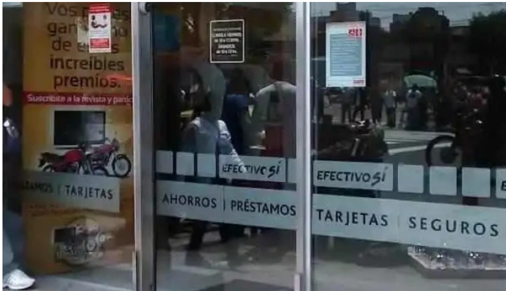
Efectivo si liniers cdad autonoma de buenos aires