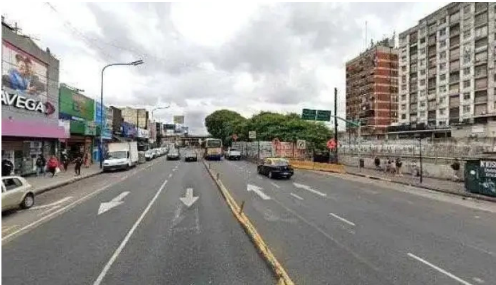
Efectivo si liniers direcciondeg