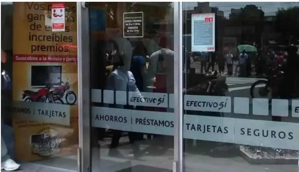
Efectivo si liniers direccion