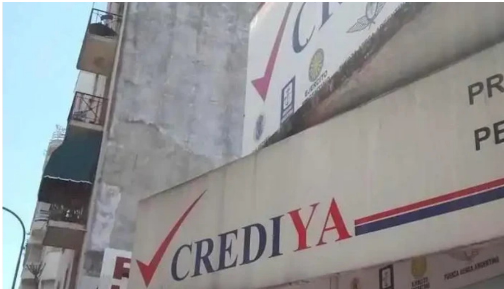
Crediya cdad autonoma de buenos aires