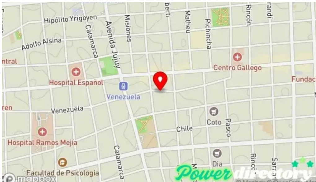
Creditos prestamos personales capital federal buenos aires mapa