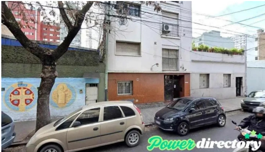
Creditos prestamos personales capital federal buenos aires cdad autonoma de buenos aires