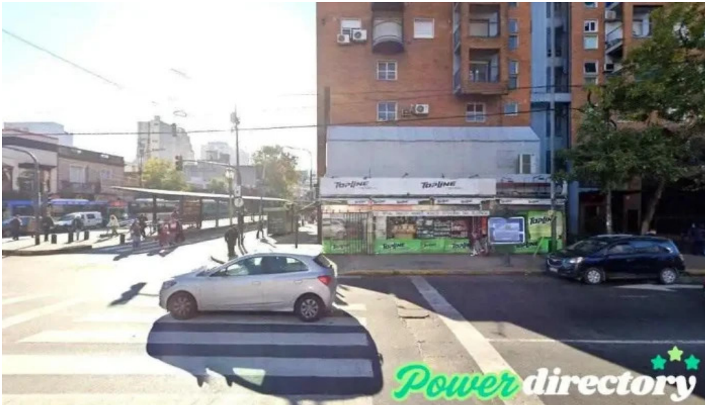
Creditos flores cdad autonoma de buenos aires