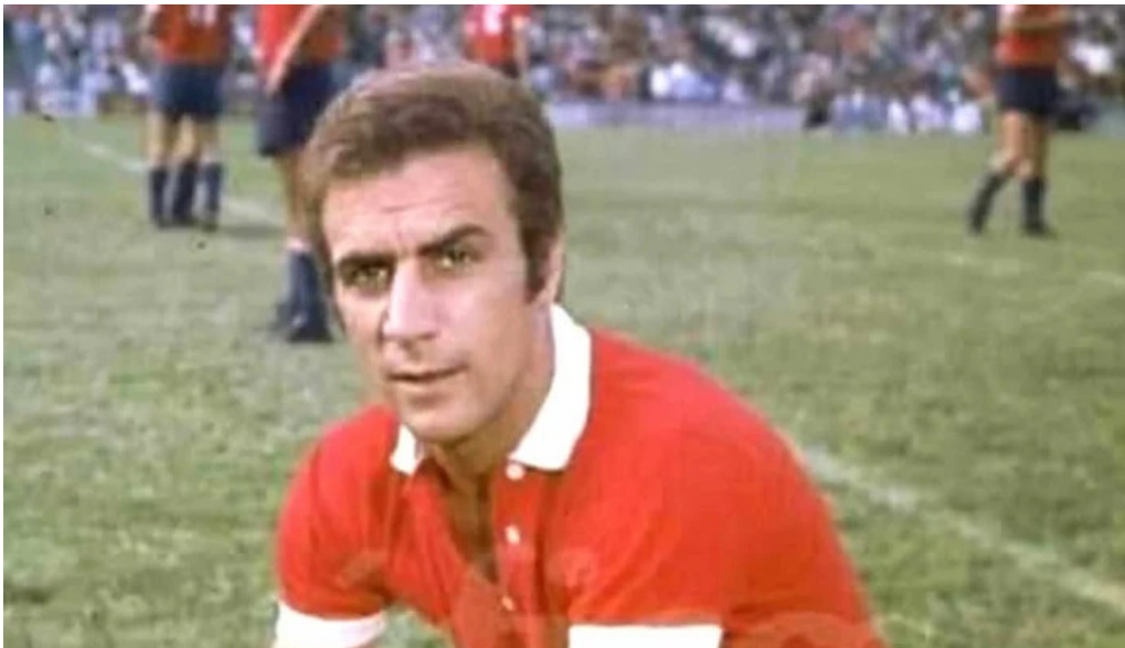
Credito guru cdad autonoma de buenos aires