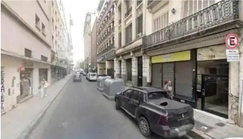
Credito guru donde